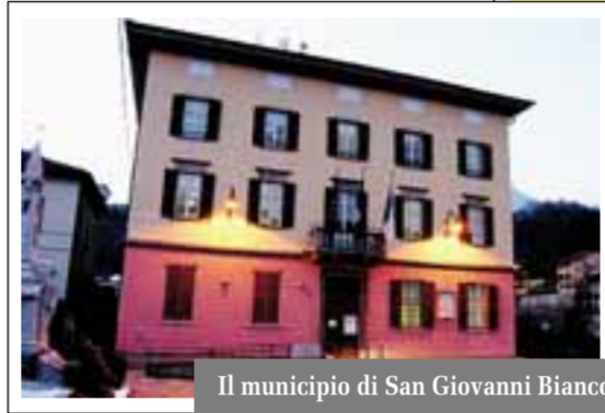
Il municipio di San Giovanni Bianco

Una panoramica tutt'altro che esaltante. «Ma certamente – continua Coretti – quella della Corte dei conti non è la classifica della vergogna. I trasferimenti dello Stato sono diminuiti, le spese dei servizi aumentano e l'indebitamento dei Comuni è un male necessario. Qualcuno ci ricamerà sopra strumentalizzando i numeri per calcoli politici, ma credo che i cittadini abbiano compreso la situazione e i sacrifici che debbono mettere in conto per mantenere il livello dei servizi». Preso atto della situazione un'amara ironia comincia a farsi largo tra piazza Vistallo Zignoni, i ponti sul Brembo e le balze di Creala: «E se invece di San Giovanni Bianco è in controtendenza rispetto alla saggezza con la quale operano e hanno operato gli amministratori bergamaschi». Scavando nel passato salta fuori il caso di Paladina. «Non lo si può paragonare a San Giovanni Bianco. A Paladina c'era stata una sentenza del giudice che ha dato